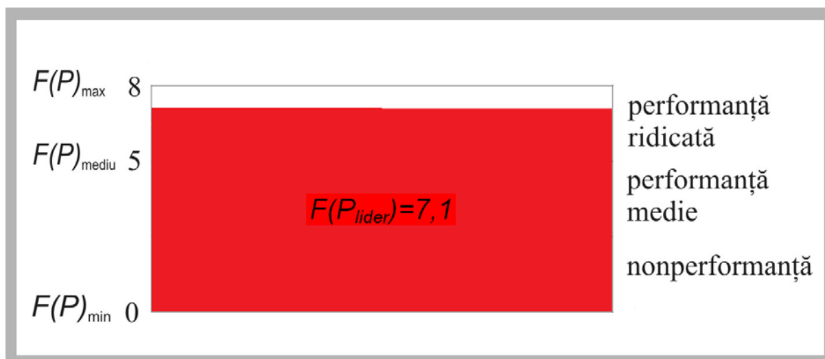
Figura 2. Reprezentarea grafică a funcției de performanță

Punctajul obținut este evidențiat și cu ajutorul diagramei bară.